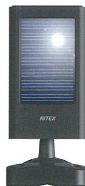
ソーラーパネル コード長さ:約5m